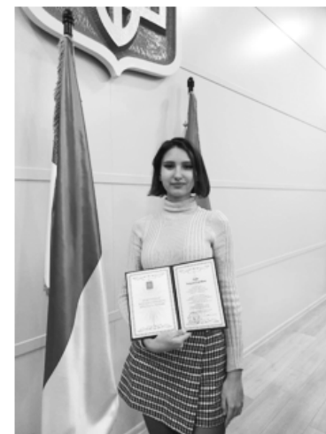
Стипендіатка міського голови Богдана Коба, студентка економічного факультету БНАУ

Наші студенти – наша гордість та майбутнє! Зичимо вам невичерпності сил і натхнення, впевнених кроків вперед до нових перемог!