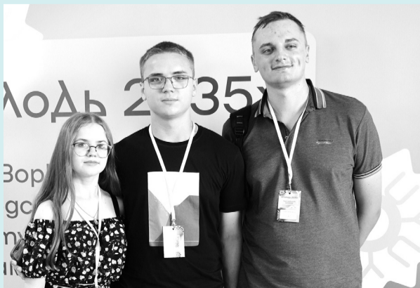
Студентська рада БНАУ

Воркшоп - це не лише комунікативна платформа, але й реальний інструмент для підвищення кваліфікації та розвитку навичок лідерства серед молоді.