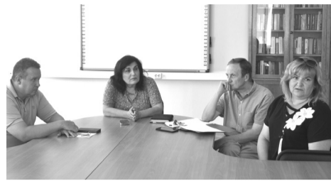
Робоча група проекту UniClaD (The UniClaD project working group)

Напередодні комісія відібрала п'ять студенток, одну аспірантку з економічного