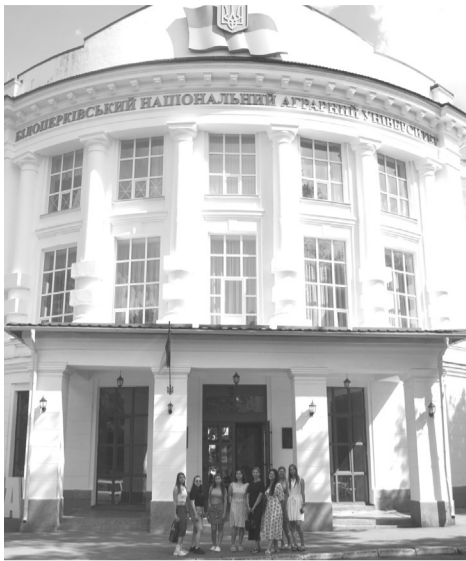
Студенти, відібрані для мобільності, перед корпусом університету (The students selected for mobility at the university entrance)