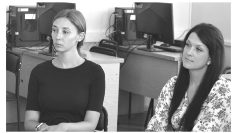
Під час обговорення завдань проекту UniClaD (During the discussions of the tasks of the UniClaD project)

Протягом вересня команда університету навчатиметься разом з угорськими студентами на факультеті сільськогосподарських наук, де матиме як обов'язкові, так і дисципліни за вибором. Передбачаються також практичні заняття у наукових лабораторіях університету